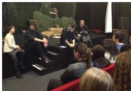
Hall de la Chanson