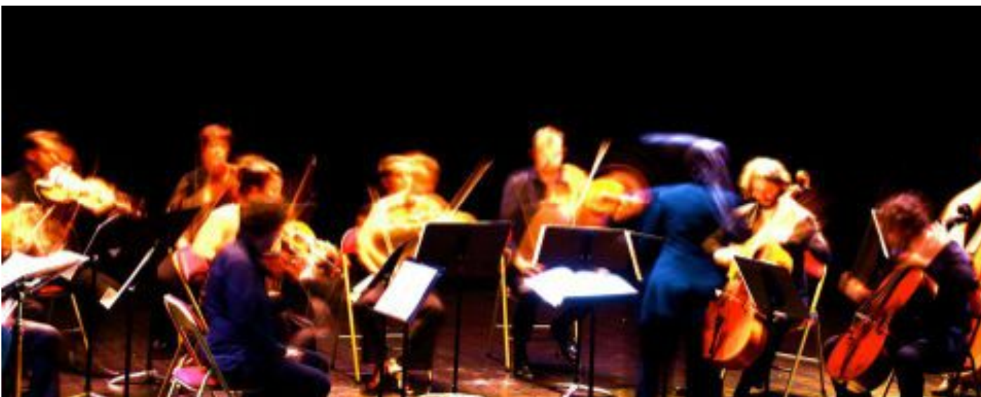
Paris Mozart Orchestra