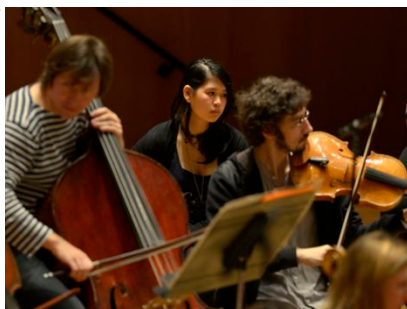
Orchestre Philharmonique de Radio-France